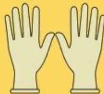
Luvas de procedimento