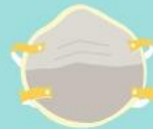
Máscara N95/PFF2 ou equivalente